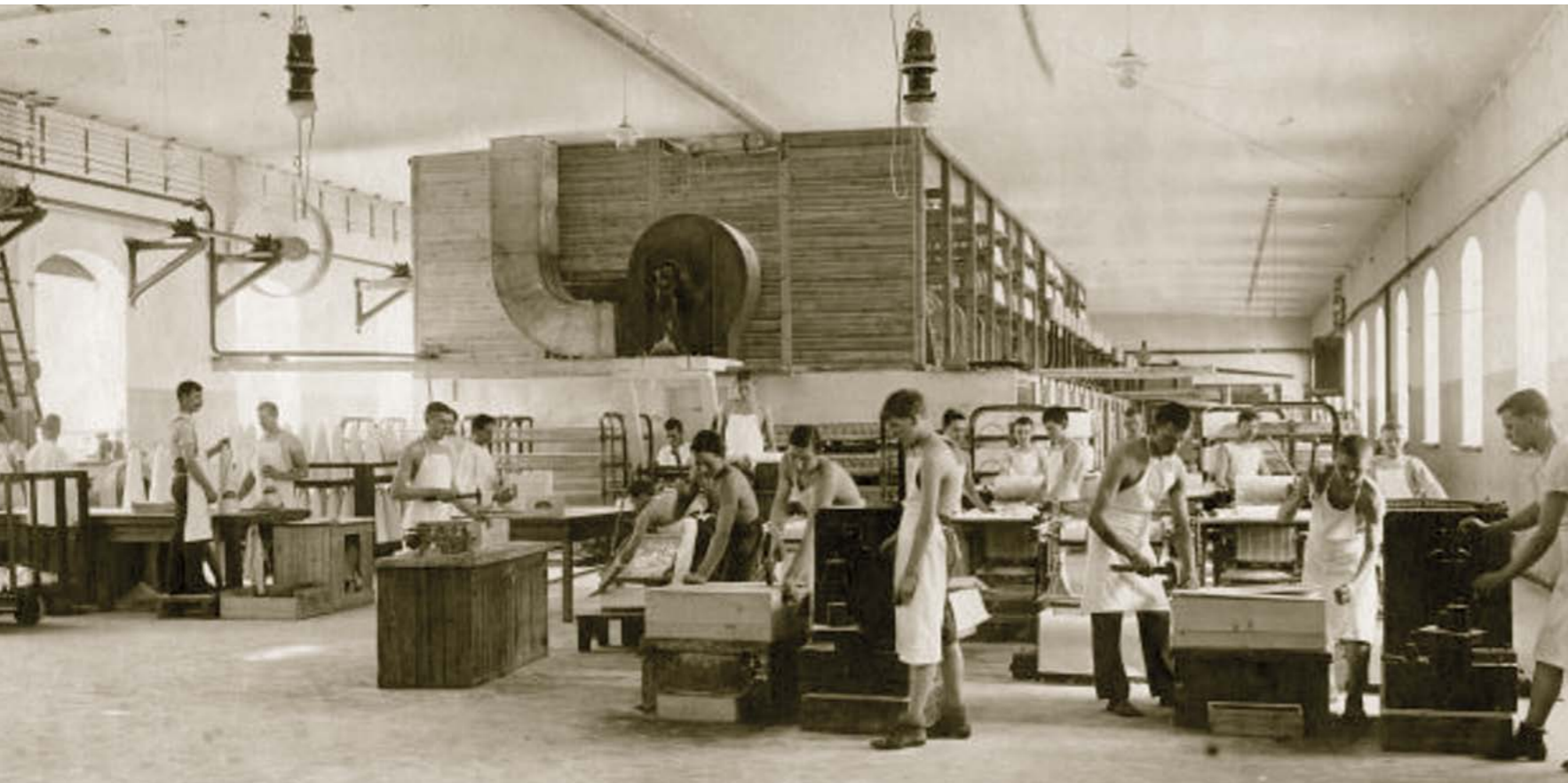
▼ KUVASSA Kotkan Sokeritehtaalla oli niin kuumat työolot, että jotkut työntekijät työskentelivät uima-asussa. Kuva vuodelta 1913.

Millaista oli työnteke Suomen uudenaikaisimmalla sokeritehtaalla Kotkassa 110 vuotta sitten?