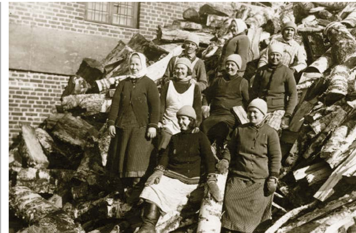
▼ KUVASSA Sokeritehtaan naiset halkohommissa vuonna 1935.

Vuonna 1922 ostettiin niin sanottu Seppälän talo, johon saatiin sijoitettua kolmisenkymmen-